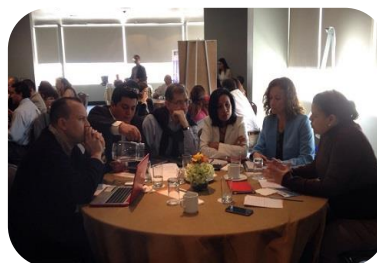
CONFERENCIA REGIONAL EITI EN LAS AMERICAS