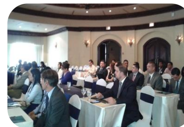
SEMINARIO CADENA DE VALOR DE LAS INDUSTRIAS EXTRACTIVAS