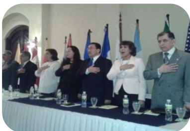
I Congreso Internacional de Minería