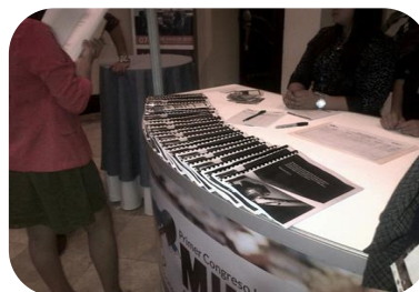
DIFUSION INFORME DE CONCILIACION