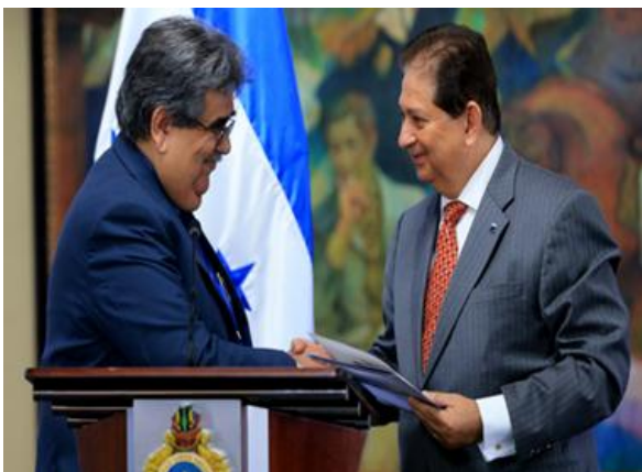
Entrega Oficial del Informe de Autoevaluación de Gobierno de medio término del II Plan de Acción de Gobierno Abierto Honduras 2014-2016

El Presidente Hernández establece como eje transversal y prioritario de su gestión, transparentar las acciones del Gobierno promoviendo la transparencia, la rendición de cuentas, la cultura ética y el respeto a la ley y seguridad jurídica, al cumplirse el segundo año de su gestión gubernamental, Honduras ha logrado grandes avances y aciertos significativos en el tema de transparencia y lucha contra la corrupción y la impunidad.